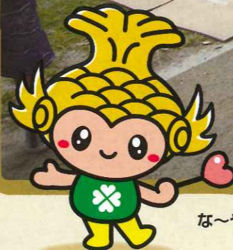
な～や アツツも一緒に赤い羽根共同募金運動中! / 熱田区社会福祉協議会 関連記事:4ページ